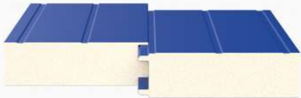
Двойной «шип-паз» (Z2/Z3)