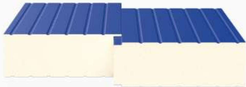
Одинарный «шип-паз» (Z5)